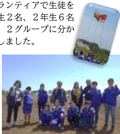
座間市長さんと記念撮影

来年は、今年以上に多くの生徒が参加し「座間の大凧」に関心をもってくれることを願っています。今回参加してくれた8名の生徒には感謝です!!