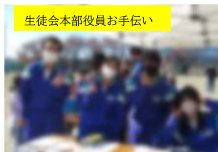
生徒会本部役員お手伝い