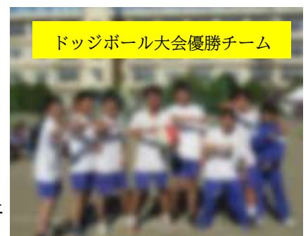
ドッジボール大会優勝チーム

東中学校区小中学生を対象に、本校グラウンドにて実施されました。今年も、10チーム参加のドッジボール大会をはじめ、ストラックアウト、生徒会本部の出題による〇×クイズなど、晴天の下、大いに盛り上がりました。なお、ドッジボールの優勝チームは野球部で結成された「べえすぼうる」でした。そして表彰式のあとは、恒例の美味しいカレーライスをいただきました。