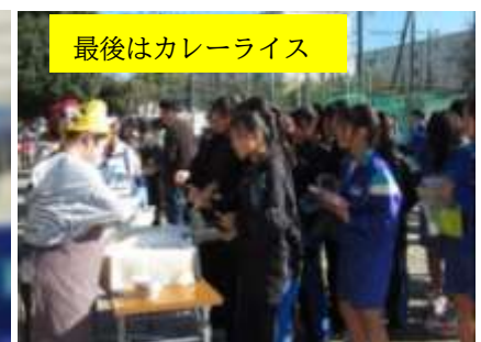
最後はカレーライス