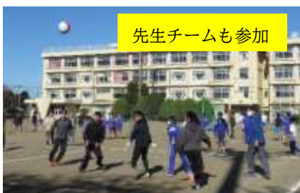
先生チームも参加