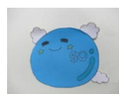
50周年記念キャラクター 「ふわりん」