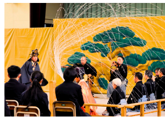
能「土蜘蛛」の蜘蛛糸を武器に戦う場面