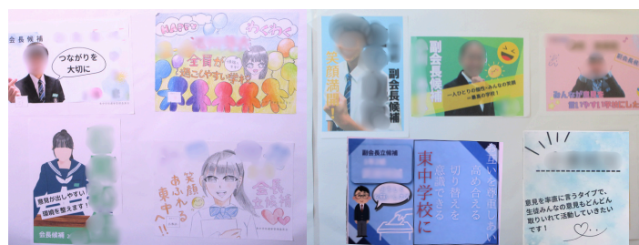
校舎内の選挙ポスター

11月18日(火)から東中学校の新たなリーダーを選ぶための新生徒会本部役員選挙の取り組みが始まりました。朝の選挙運動、各学級を回っての選挙演説などが12月4日まで行われ、5日(金)に立会演説会・投票を迎えます。