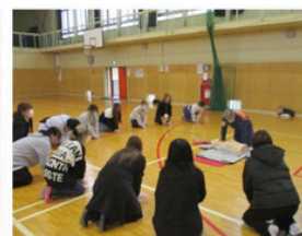
心臓マッサージのやり方