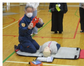
気道確保について

11月13日(木)、東中PTA地区成人委員会主催で「成人講座」～AEDの使い方を知ろう～が実施されました。講師として座間消防署東分署の救急救命士の方にお越しいただき、目の前で「人が倒れている。脈が触れない。息をしていない。」などの状況が起こった際にどのような対応をすればよいか、実践を交えながら学びました。心肺蘇生法やAEDの使用法を中心に学びましたが、特に救急車が到着するまでかかるとされる10分間、緊迫感のある中、参加者全員で続けた心臓マッサージは貴重な体験となりました。また、参加者から数多くの不安点について質問がされる中、人間の体の構造などにも触れながら、的確にアドバイスをいただきました。