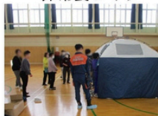
避難所用テント設置