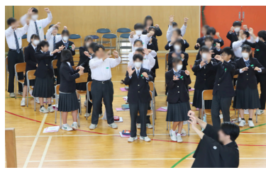
柿を盗みとる場面を生徒と一緒に演じたり、謡を謡ったりする体験もしました。