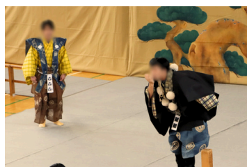
狂言「柿山伏」の柿を盗み食いする場面