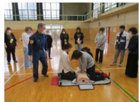
10分間の心臓マッサージ