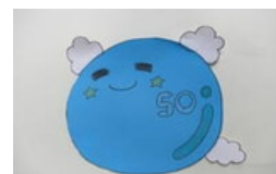
50周年記念キャラクター 「ふわりん」