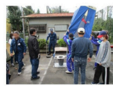
マンホールトイレの設置