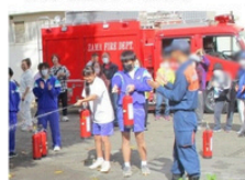
消火器取り扱い訓練