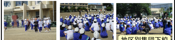
地区別集団下校の確認

4月21日(火)、今年度第1回目となる避難訓練を実施しました。今回は震度5弱の地震発生後、1階の調理室から火災が発生したという想定で行われました。生徒たちは事前指導でヘルメットの着用練習を行い、緊急放送が流れると迅速に机の下で身を守る安全行動をとりました。その後の避難では、調理室火災を考慮した経路を選択し、煙を吸わないよう姿勢を低くしてハンカチなどで口を覆いながら、静かにグラウンドへと移動しました。また、各学年で負傷者の搬出を想定した訓練も併せて行われました。