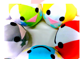
50周年記念キャラクター「ふわリン」

家庭科部のみんなの手作りです。この「ふわリン」のぬいぐるみは保健室に飾ってあります。