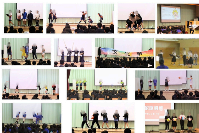
部活動紹介の様子