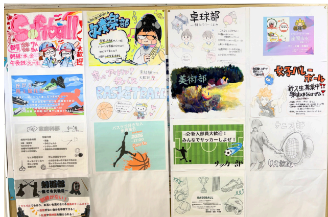
部活動紹介ポスター

4月7日(火)の対面式では、1年生の堂々としたクラス紹介に対し、2・3年生が合唱「Let's Search For Tomorrow」で歓迎。先輩たちの力強い歌声が、新入生の不安を希望へと変えてくれました。続く8日(水)の「オリエンテーションA」では、生徒会役員から学校生活のルールや委員会活動についての説明があり、1年生は真剣な表情で中学校生活の土台を学びました。そして9日(木)の「オリエンテーションB」では、2・3年生による活気あふれる部活動紹介が行われました。すぐに仮入部が始まり複数の部活動を体験後、20日(月)に本入部となり、1年生の部員としての活動が始まりました。