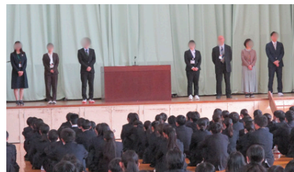
新たに着任された先生方

4月6日(月)、着任式が行われ、本校に新たに加入した教職員が紹介されました。この日は、登校後すぐに新しいクラスのメンバーが発表され、その後の始業式では、担任・教科担当の先生が発表されました。生徒たちにとっては、新生活への期待と不安が入り交じる、少し複雑な心境の1日になったかもしれません。新しい先生、仲間と一緒に心に残る1年にしていきましょう。始業式の校長講話では、「鳥の言葉が分かる研究者」のエピソードが紹介され、日常の中で疑問や面白さを「感じる」こと、それを自ら「探る」こと、そしてその取り組みを続けていくことが、やがて自分自身の道を「築く」ことにつながっていくという内容の話がありました。