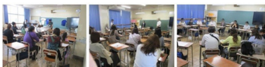
部活懇談会の様子

部活動懇談会では、各部より活動方針や留意事項をお伝えしました。今後とも各部活動へのご理解とご協力をよろしくお願いいたします。