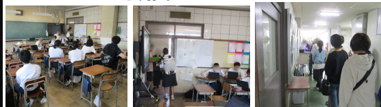
引き渡し訓練の様子

5月18日(月)に、市内小中学校一斉の「災害時引き渡し訓練」を実施しました。今回は南海トラフ地震臨時情報が発表されたと想定し、教室内での引き渡しを行いました。生徒たちは「訓練ではなく本番」の意識を持って臨み、保護者の皆様をお待たせすることなく、スムーズに引き継ぐことができました。上履きのご持参や校内の一方通行など、多くのルールにご協力いただき、混乱なく安全に終了できたことに心より感謝申し上げます。